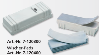
Art.-Nr. 7-120300 Wischer-Pads Art.-Nr. 7-120400